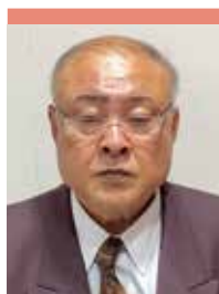
武豊福寿園 家族会会長

さて、昨年2024年はパリオリンピックが開催され、日本選手たちが素晴らしい成績を残しました。その反面、日本国内では気候変動や異常気象による自然災害が増加しています。例えば夏については過去数年間で夏の気温が上昇しており、2025年も同様の傾向が続く可能性があるとの予想も聞かれました。その様な状況の中、新たな年も始まり職員の方々には昨年同様、利用者の体調管理に層のご苦労をお掛けすることになると思います。2025年が始まり、私共家族会は皆様のお力添えを受けながら今年年頭張つて参りたいと思っております。本年も変わらぬご協力のほど何卒よろしくお願い申し上げます。