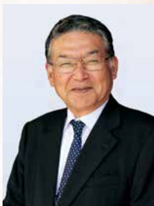
常務理事・施設部長

今年も変わらぬご理解とご協力をお願い申し上げますとともに、皆様にとって明るく楽しい年となりますようご祈念申し上げます、新年のご挨拶とさせていただきます。