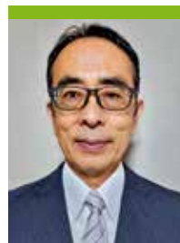
ひまわりの街 家族会会長

これからも職員の皆様と家族会が力を合わせて行事を企画して参りますので引き続きご協力賜りますようお願い申し上げます。