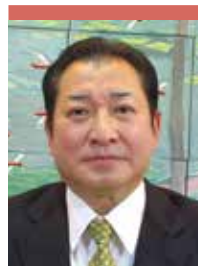
くすのきの里 家族親睦会 世話人代表