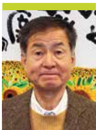
ひまわり邸 家族会会長

最後に、「ひまわりの街」の益々のご発展と、職員の皆様や入居者ご家族のみならずとて素晴らしい一年になりますよう祈念し、年頭のご挨拶とさせていただきます。