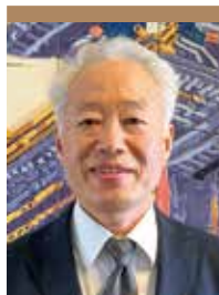
海福寿園 家族親睦会 世話人代表

これもひとえに施設長始め職員の皆様のお陰であり、ここに深く御礼を申し上げます。本年におきましてもこの様な楽しい機会が得られることを願いつつ、皆様にとりまして幸多き一年となりますようご祈念申し上げ新年のご挨拶とさせていただきます。