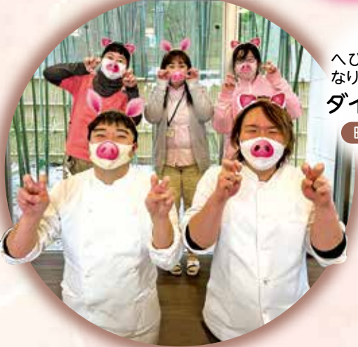
へびのように細くなりしたい! ダイエット部員 昭和の里職員