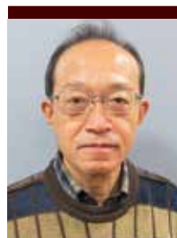
ちた福寿園 家族会会長